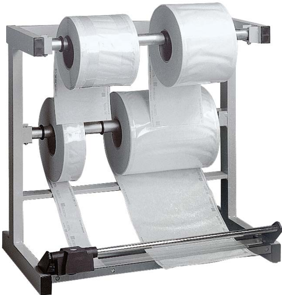
„polystar®“ Folienrollen - Magazin 510 mit manueller Schneidvorrichtung

www.polystar-hamburg.de eMail: info@polystar-hamburg.de