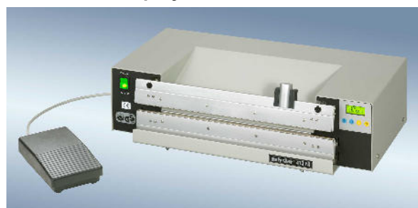
polystar® 413 M mit Schneidvorrichtung