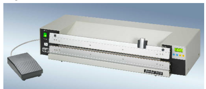
polystar® 613 M mit Schneidvorrichtung

www.polystar-hamburg.de eMail: info@polystar-hamburg.de