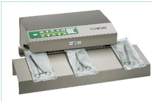
981 DSM mit Beutelaufagetisch