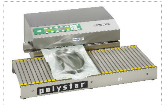
981 DSM mit Rollenbahn

www.polystar-hamburg.de eMail: info@polystar-hamburg.de